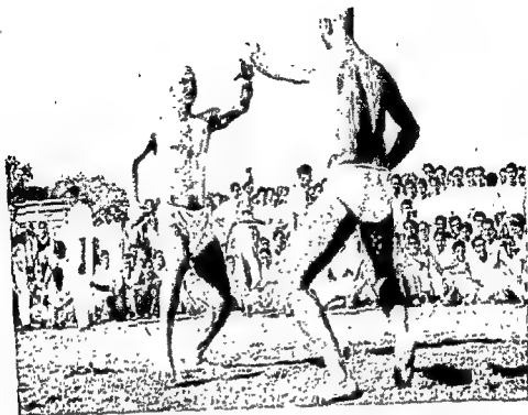
FIG. 3 Vajramusti Wrestling: Beginning